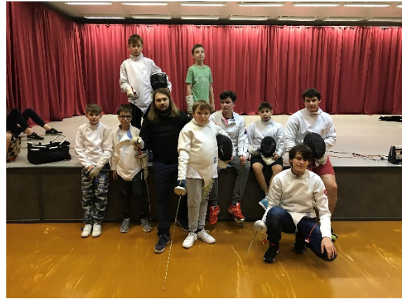
Šermiarska spoločnosť WILLARD 1 + 9