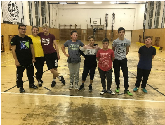
Klub šermu Snina 1 + 7

V zmysle schváleného plánu kontrolnej činnosti kontrolóra SŠZ na rok 2019 v dňoch 20. až 22. 11.2019 boli vykonané kontroly v štyroch /4/ šermiarskych oddieloch v Snine, Košiciach a vo Zvolene.