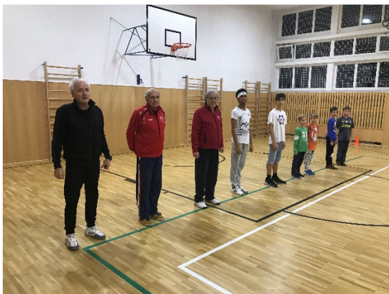
Košický šermiarsky klub 1903 3 + 6